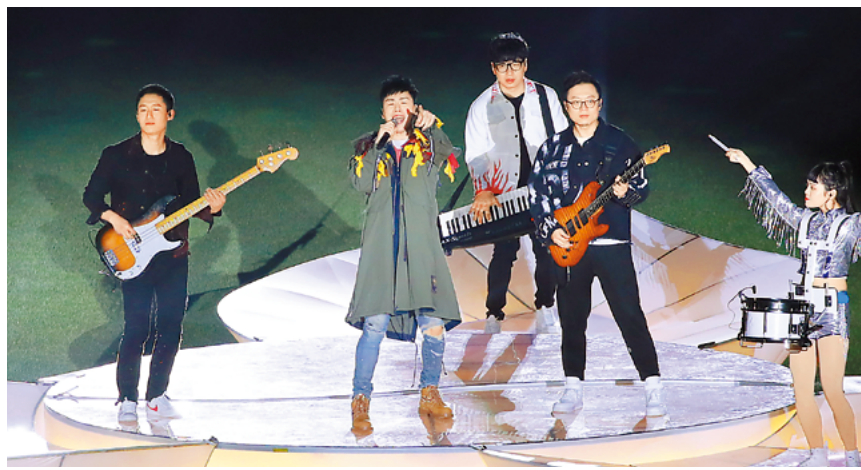
音乐才子胡彦斌献唱中超主题曲《超越》