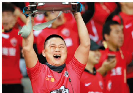
← 深圳佳兆业补时逆转天津天海后，一名深圳球迷高举助威鼓庆祝