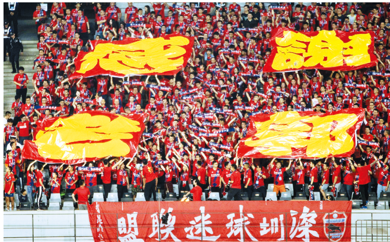
比赛现场，深圳球迷在观众席打出标语感谢佳兆业集团主席