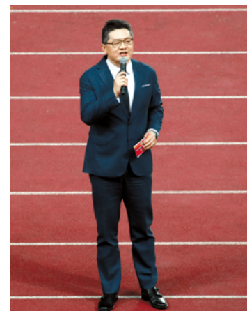
CCTV5 著名解说员张斌担任主持人