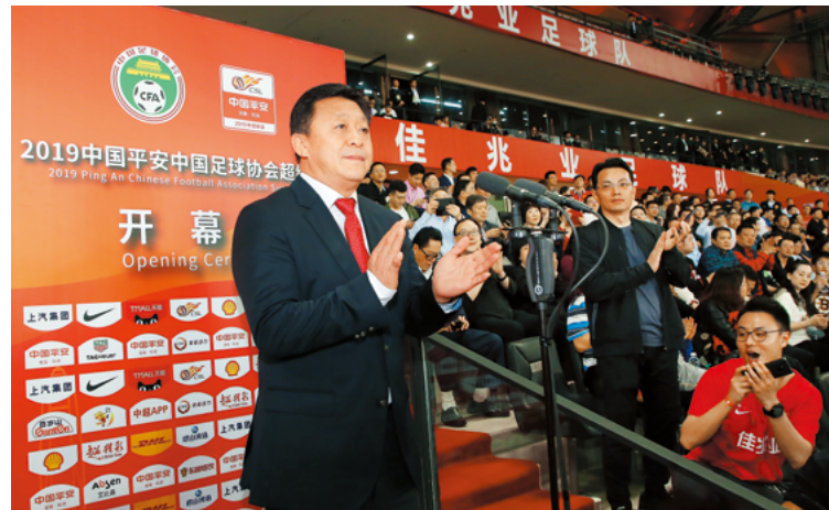
国家体育总局副局长、党组成员，中国足球协会党委书记杜兆才宣布 2019 中超联赛开幕

中超联赛开幕式作为中国顶级职业联赛的年度首秀，在深圳这座改革开放前沿城市落地，并向全球 96 个国家和地区进行直播，全面地展示了中超联赛及深圳的城市魅力。