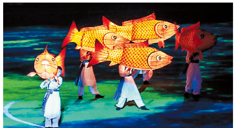
深圳本地文化特色非遗视觉秀《鱼灯舞动》