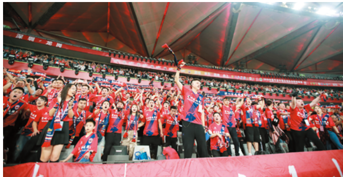
↑ 2019赛季首轮深圳佳兆业球迷激情助威